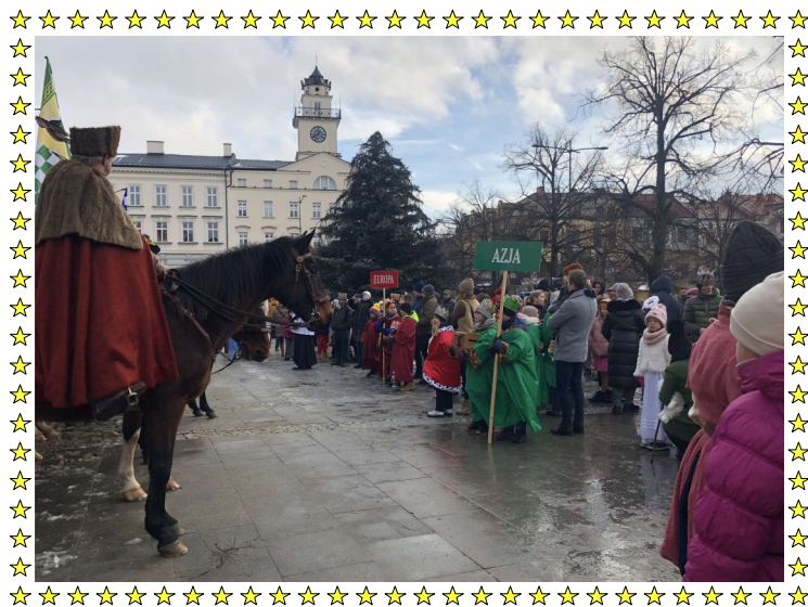
FOT. ORSZAK TRZECH KRÓLI

GAZETKA UCZNIÓW SZKOŁY PODSTAWOWEJ im. Jana Pawła II w ZESPOLE SZKOLNO —PRZEDSZKOLNYM w Stróżówce