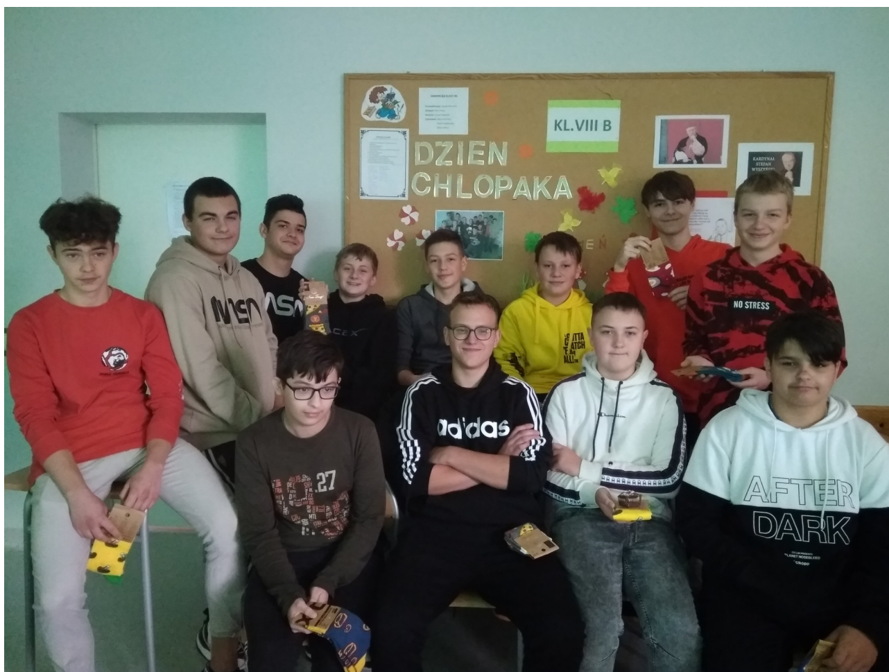
Fot. Chłopcy z klasy VIII b

W ten dzień dziewczęta z klasy 8b przygotowały chłopcom niespodziankę. Upiekły czekoladowe babeczki ze słodką posypką, dla wszystkich uczniów z klasy. Dodatkowo chłopcy otrzymali w prezencie kolorowe skarpetki. Ten dowcipny prezent wszystkim obdarowanym bardzo się spodobał. Klasowy Dzień Chłopaka dopełniła wspólna zabawa przy quizach Kahoot.