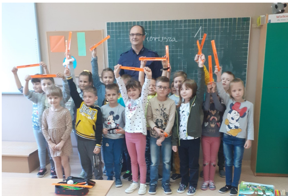
Fot. KLASA I— SPOTKANIE Z POLICJANTEM