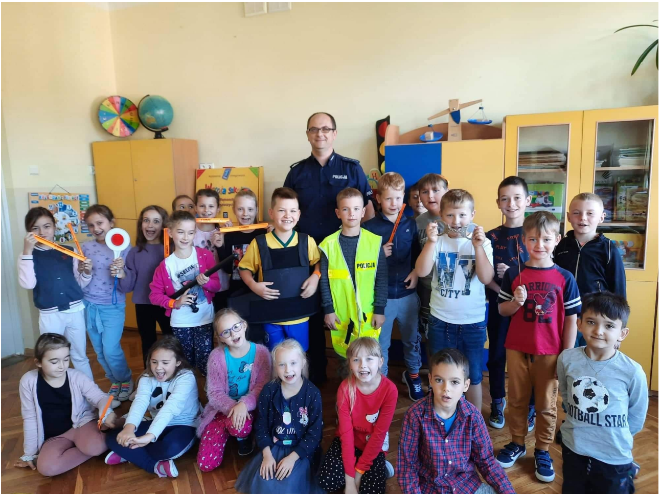
FOT. Uczniowie klasy II

9 września 2021 r. każda klasa edukacji wczesnoszkolnej odbyła spotkanie z Policjantem. Tematem spotkania było utrwalenie zasad ruchu drogowego oraz przypomnienie, w jaki sposób bezpiecznie przechodzić przez ulice w drodze do i ze szkoły.